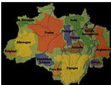
Países Europeos en la franja amazónica

Frente a datos alarmantes sobre la creciente devastación de la selva amazónica detectada por los sistemas satelitales, el Ministerio Público Federal está investigando un anuncio publicado en un periódico en el estado de Pará, llamando a los agricultores a promover el "día del incendio". – el 10 de agosto.