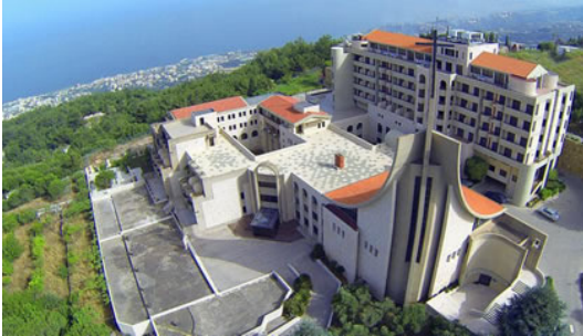
Notre Dame du Mont

Del lunes 26 al jueves 29 de octubre 2020 en un entorno magnífico en Notre Dame du Mont (Adma Fatka) cerca de Jounieh en Libano