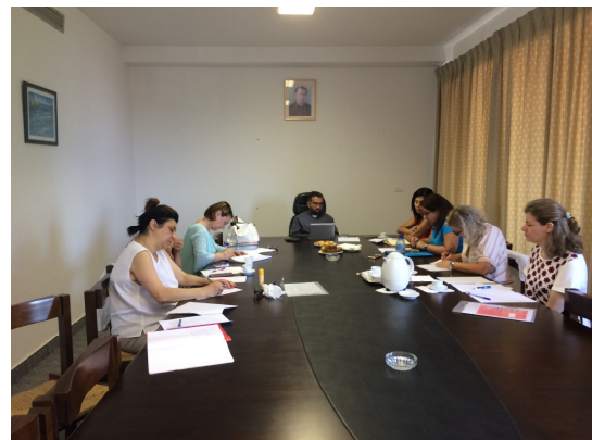
Equipo del Líbano que nos acogerá